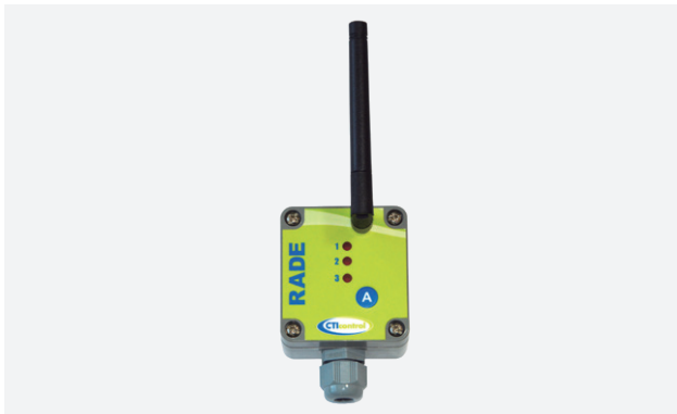
Antena radiowa do łączności