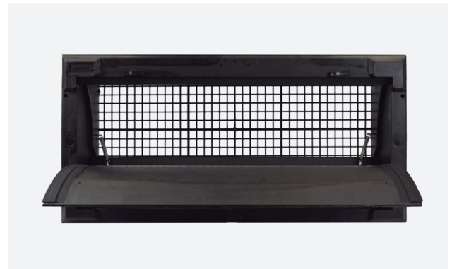
Wlot powietrza z poliuretanu